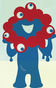
2025年大阪・関西万博 公式キャラクター ミヤクミヤク