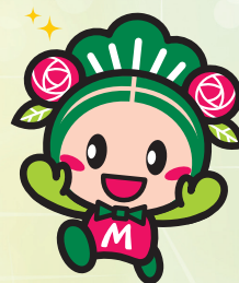
松原市 マスコットキャラクター <マッキー>