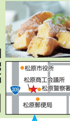
写真 (商品・店舗など)